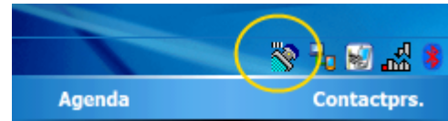
Ingesteld op Barcode (dus goed)