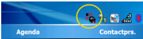
Ingesteld op RFID (dus fout)

De CF-insteekkaart kan Barcodes lezen, maar ook RFID-chips. Als de barcode-lezer niet werkt, kan het zijn dat de kaart ingesteld staat op RFID in plaats van Barcode. Je kunt dat in het startscherm zien: